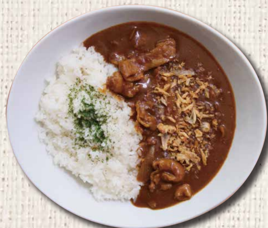
⑩ 丘珠カレー 1,000 円