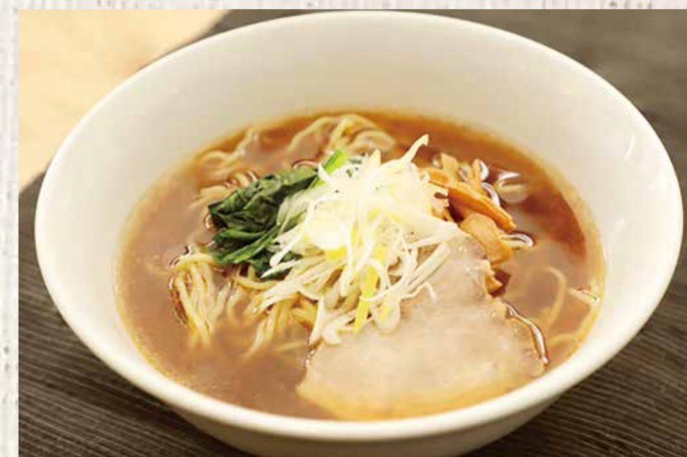
札幌ラーメン (②味噌・③醤油・④塩) 900 円