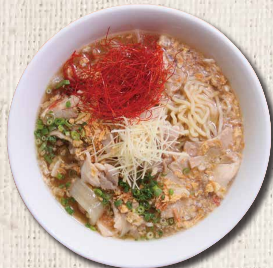
① 丘珠ラーメン 1,000 円