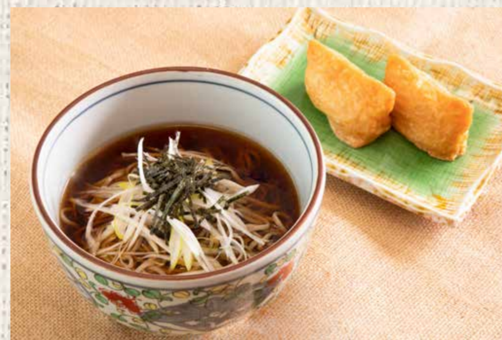
④② 朝そば / ④③ うどんセット 780 円